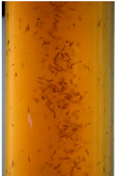
Zooplanktonröhre mit adulten Artemia „salina“, gefüttert mit der Kieselalge Phaeodactylum tricorutum

Extra lange Reinigungsbürste für z.B. Planktonröhre Durchmesser: 30 mm Besatzlänge: 125 mm Gesamtlänge: 900 mm Bestellnummer: Brst-001