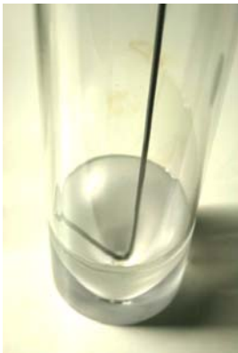
Plexiglasröhre mit Konus und Schaber