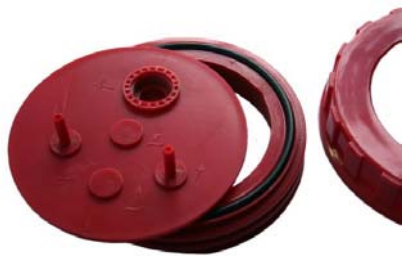
Einzelteile des Kopfes