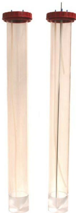
Phyto- und Zooplanktonröhre

Die Zooplanktonversion enthält Anschlüsse und einen Schaber aus Spezialstahl, um Ablagerungen und Detritus im Konus abzutragen, damit diese mit einem Schlauch abgesaugt werden können.